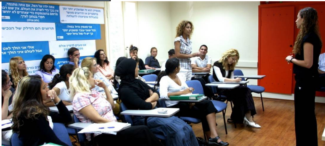
סדנת הכנה לעבודה בסטרייב תל אביב